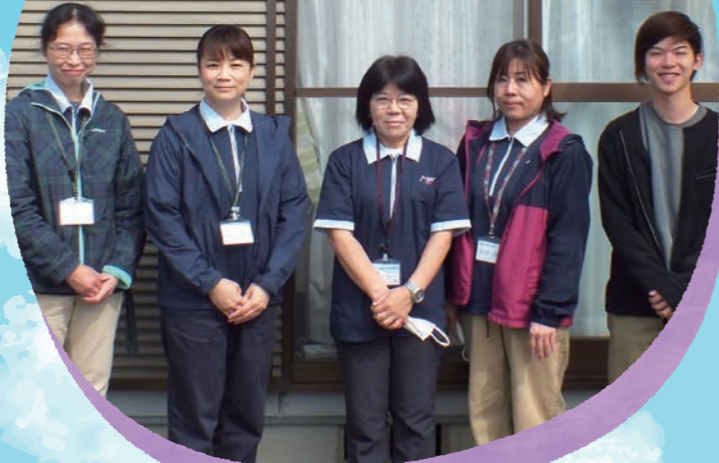
古賀市 第3地域包括 支援センター