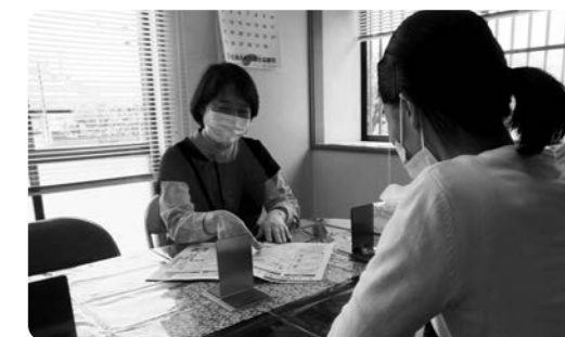
プライバシーの守られた個室でお話を伺いますので、ご安心ください。

地 域包括支援センターでは、保健師・看護師、主任ケアマネジャー、社会福祉士等が連携し、住み慣れた地域で安心して生活を継続できるような支援を行います。古賀市では今年度よりその窓口が3中学校区に分かれ、より身近に相談できるようになりました。お電話いただければ、ご自宅までお伺い致しますので、お気軽にご相談ください。