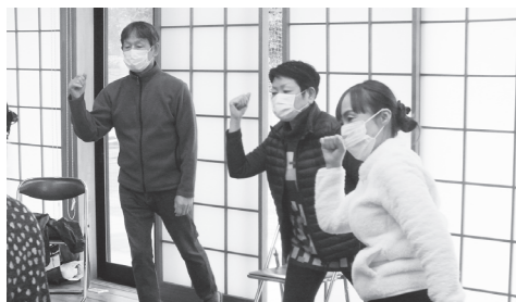
福祉会のサロン活動