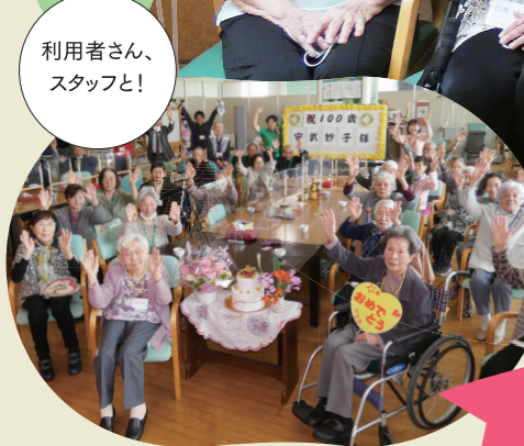
利用者さん、スタッフと!