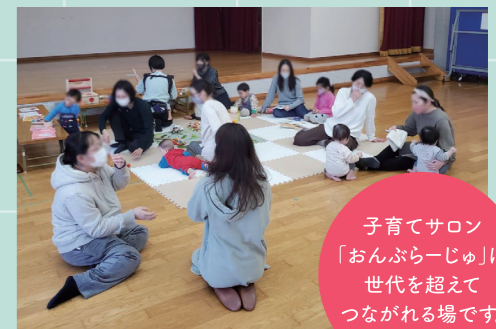
子育てサロン「おんぶらーじゅ」は世代を超えてつながれる場です。

その姿は、微笑ましいものです。子ども達や家庭の事は、困りごとがあっても、中々外からはわからないものです。さらにコロナ禍で、なお一層分かりづらくなっています。校区の民生・児童委員や学校とも連携しながら、地域の子ども達をあたたく見守っていく活動をしていきたいと思っています。