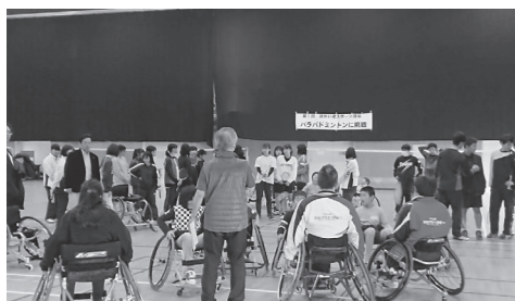
福祉団体(パラバドミントン)