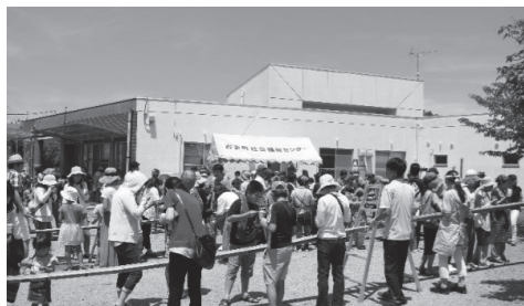
世代間交流の地域行事