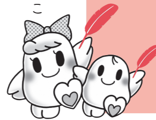
愛ちゃんと希望くん