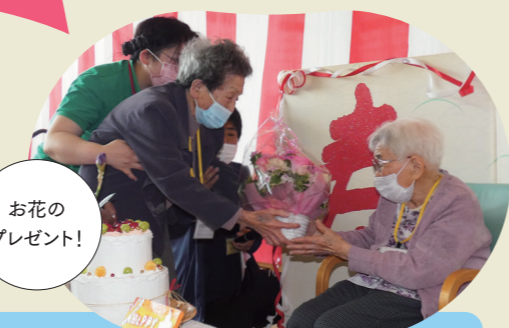
お花のプレゼント!