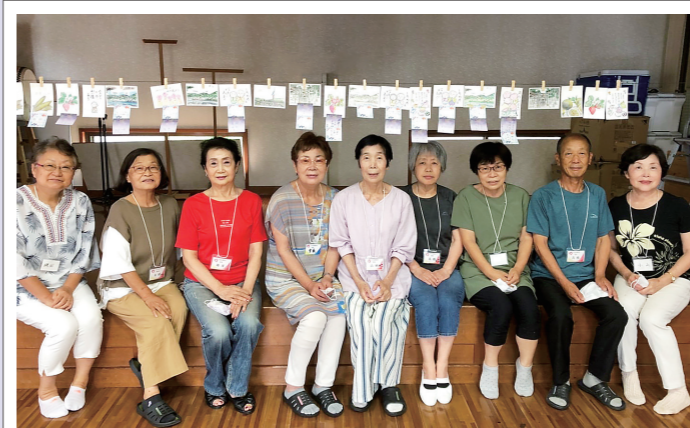
小竹区福祉会 福祉員の皆さん