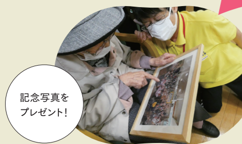
記念写真をプレゼント!