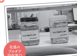
社協の プルタブ 回収窓口

【お問い合わせ】古賀市社会福祉協議会総務福祉係 TEL:092-944-2941 FAX:092-944-2942 soumu@kogasyakyou.jp