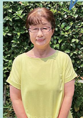
民生・児童委員歴 9年目 (内主任児童委員歴3年)