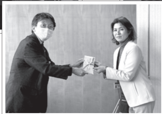
正興電機グループ/役員従業員一同 /正興電機労働組合

令和5年12月22日(金)に、「一般社団法人生命保険協会福岡協会様」から福祉巡回車を寄贈いただきました。