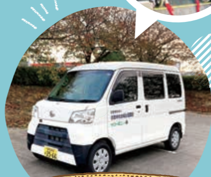
車いす対応車貸出