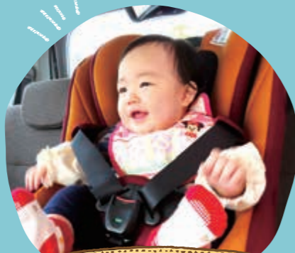
チャイルドシート貸出