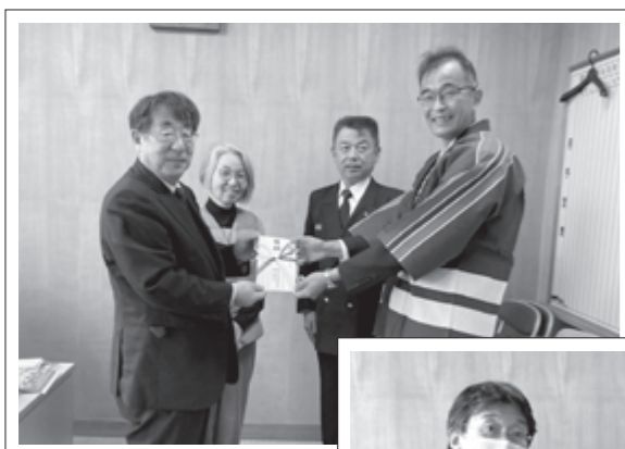
粕屋北部地区防災協会