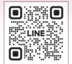
古賀市社協 LINE公式アカウント