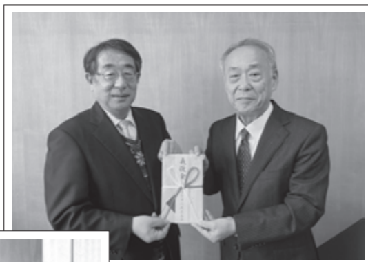
古賀市行政区長会