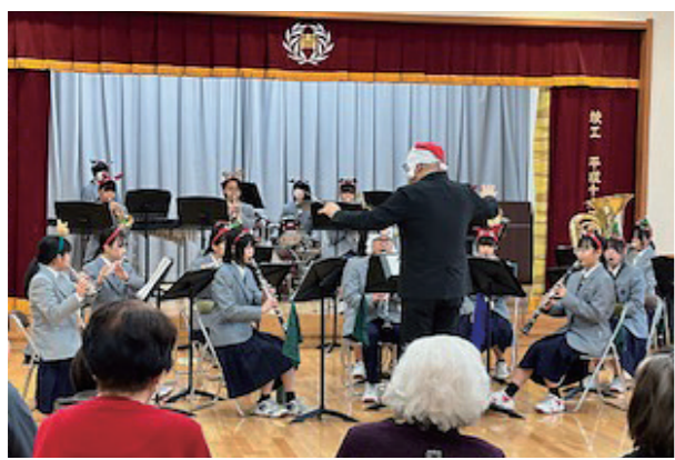
クリスマス会 古賀東中学校吹奏楽部の演奏を聴いている様子