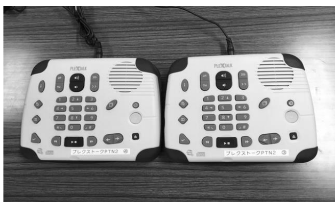
車両競技公益記念財団の助成を受け購入したマイクとプレクストーク

今年度、公益財団法人 車両競技公益記念財団の助成を受け、音訳用マイク 2 本とプレクストーク 2 台を新しく購入しました。スムーズに録音し、CD の音声チェックの時間が短縮できるなど、更に有意義な活動ができるようになりました。音訳に興味のある方は一度見学にきてみませんか？一緒に活動する仲間も募集しています！詳しくは下記連絡先までお問い合わせください。