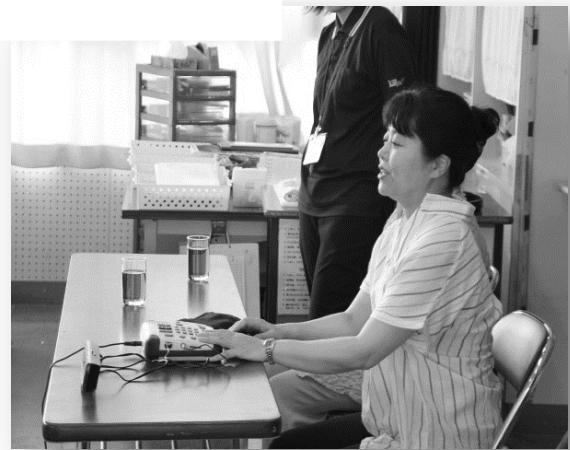
「ネットワーク こだまの会」の会員さんご利用されています。

CD を利用したい方だけでなく、「カナリヤ」さんの活動に興味がある方はボランティアセンターまでお問い合わせください！