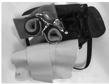
高齢者疑似体験セット（子ども用）

ゴーグル、ステッキ（杖）、前かがみ姿勢ベルト、ひじ・ひざサポーター、おもりバンド、イヤーマフ