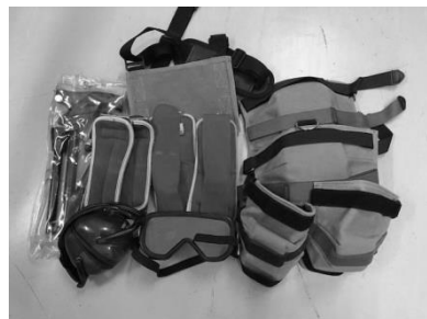
高齢者疑似体験セット（大人用）

福祉体験や学習を実施する学校や団体等に体験セットの貸出を実施しています。また、プログラム作りの相談や職員の派遣もお受けしておりますので、下記連絡先までお問い合わせください。