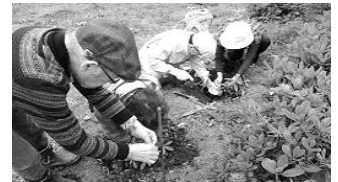
平成29年度講座修了者による記念樹植え

対象：おおむね60歳~70歳の古賀市在住の方で、 原則全講座を受講できる方 定員：30名(太枠は先着順・要事前申込み) 主催：古賀市 運営：古賀市社会福祉協議会 ※お問い合わせ・お申し込みは下記連絡先まで。